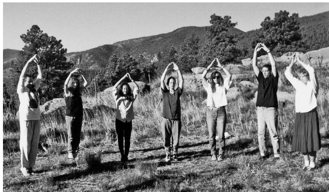
Photography of a Deep Listening Retreat, Special Collections, F. W. Olin Library, Mills College at Northeastern University. Photo and courtesy: David Felton.

Like the Sonic Meditations mentioned above, these three ensemble pieces create situations where the individual’s place within the group is constantly renegotiated and where the roles of transmitter and receiver alternate. Improvisation as conceived by the composer, for example when expecting very short reaction times as in Interdependence , presupposes an increased receptivity, an openness to the other, which is also a form of vulnerability, an acceptance of our “interdependencies”. It is a matter of entering in a process that cannot be predicted or controlled and of accepting the risk of being transformed by the other. The freedom of interpretation induced by the openness of the textual scores implies negotiating with oneself and with others, during the performance and beyond. In her text entitled “The Politics of Collaborative Performance in the Music of Pauline Oliveros”, ethnomusicologist Barbara Rose Lange recounts a performance of Four Meditations for Orchestra that caused major disagreements between two groups of musicians who came from different musical worlds. “The piece stimulates conflict by freeing musicians to apply their own ideals of preparation and expression” 7 writes Lange. Indeed, Oliveros is not afraid of conflicts if they take us on the path of self-analysis on an