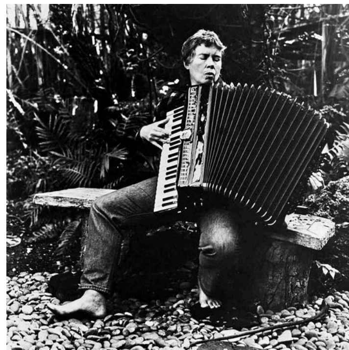
Pauline Oliveros, circa 1974.

rapidement du lit individuel à la chambrée collective, ces structures porteuses jouent pleinement leur fonction: elles portent les corps, avec toujours le repos comme usage ad hoc . Si la relation qui est au cœur de la pratique de Kyriakopoulos semble inconfortable, résistante et irrésolue de prime abord, elle s'avère profon-