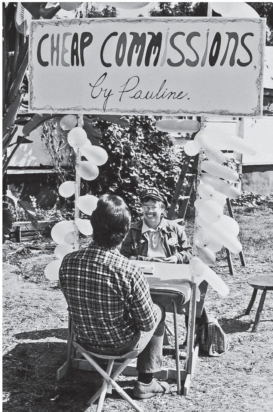
Pauline Oliveros, Cheap Commissions , 1976.