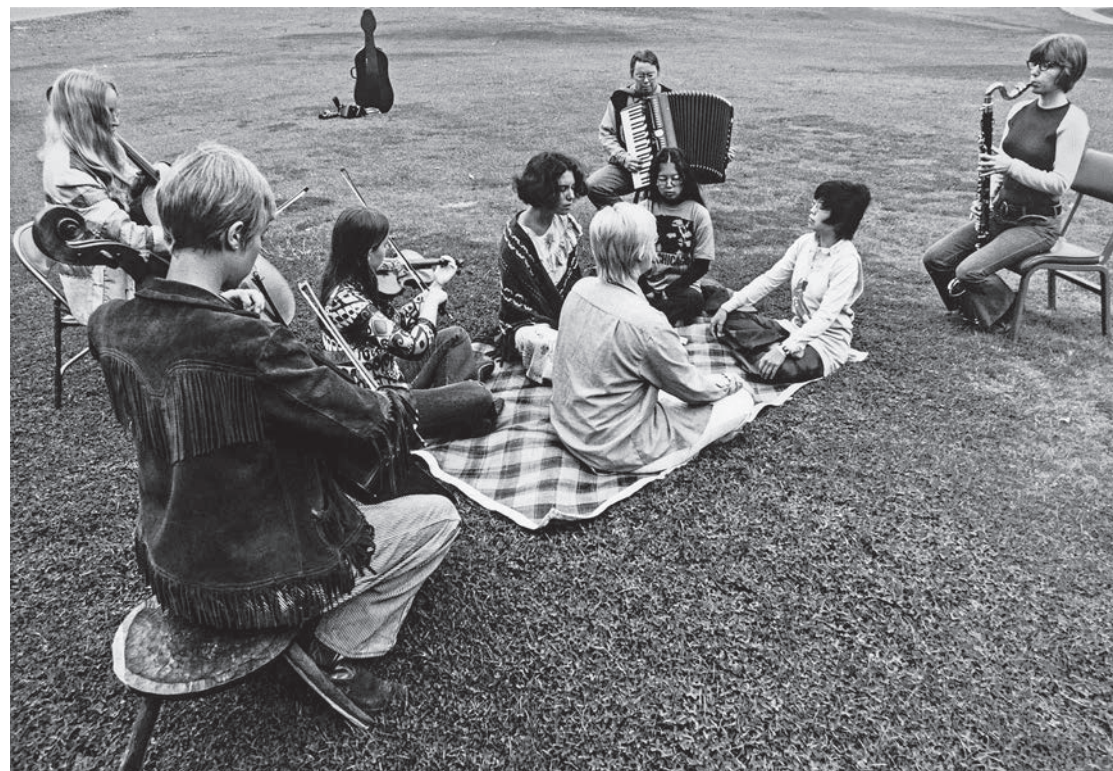
Pauline Oliveros et le ♀ Ensemble interprétant la Méditation Sonore "Teach Yourself to Fly", 1970, Rancho Santa Fe, CA. Documents de Pauline Oliveros. Mandeville Special Collections Library, Université de Californie, San Diego.

Dans l'œuvre d'Oliveros, la pratique de l'écoute s'exerce le plus souvent dans un cadre collectif ; la plupart de ses compositions mettent en jeu des principes d'improvisation et d'écoute mutuelle au sein d'un groupe. Ses célèbres Méditations Sonores , qui sont des partitions textuelles proposant des « stratégies attentionnelles », des manières d'écouter et de répondre, ont été élaborées au sein du ♀ Ensemble. Lorsqu'elles sont publiées en 1971, ses partitions deviennent interprétables par quiconque le souhaite, musicien·ne ou non, à condition, insiste Oliveros, que les participant·es s'engagent « dans un travail de groupe sur une longue période avec des réunions régulières. » Dans la majorité de ses pièces d'orchestre, qui par définition impliquent un groupe de musicien·nes, la compositrice ne cherche plus à guider l'interprétation de la musique mais donne des indications ouvertes pour improviser ensemble en privilégiant l'écoute mutuelle et la dynamique collective plutôt que la virtuosité individuelle. Par ailleurs, Oliveros encourage la rencontre entre les pratiques et les styles musicaux souvent de manière explicite, comme dans la partition Earth Ears: A Sonic Ritual (1989), présentée dans l'exposition, qui s'ouvre sur ces mots : « Tout instrument ou voix capable de suivre les instructions données peut être utilisé dans cet ensemble musical. Pour cette raison, Earth Ears se prête bien à un ensemble