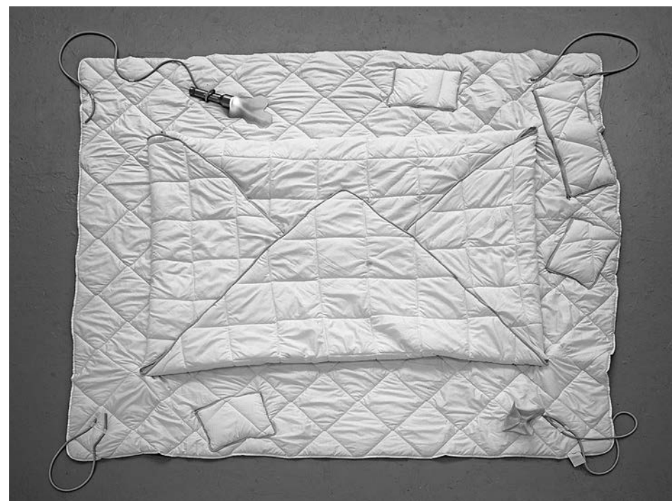
(à gauche) Konstantinos Kyriakopoulos et Xavier Michel, FACCIA A FACCIA , 2023. Photo: Konstantinos Kyriakopoulos. (en haut à droite) Konstantinos Kyriakopoulos, The Floor is Lava , 2021, vue d'exposition, ENSBA. Photo: Konstantinos Kyriakopoulos. (en bas à droite) Konstantinos Kyriakopoulos, Bed Net , 2021, couette de lit, textile, caoutchouc, plastique. Photo: Caroline Curdy.