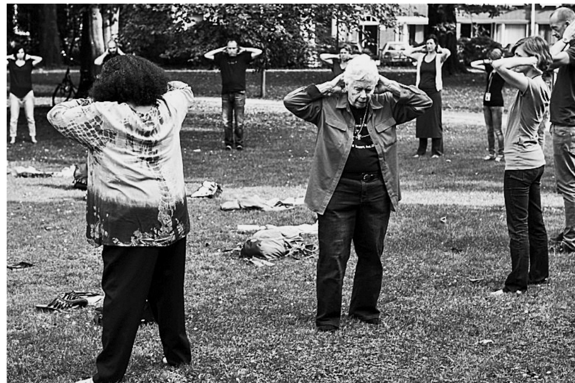
Pauline Oliveros (in the center) leading a Deep Listening session at the Incubate festival, Wilhelmina Park, Tilburg, Netherlands, 2014.

For “Un·Tuning Together”, No Anger has produced a new video in which they employ their different registers of speech: what they call their “voice-voice” or their “laryngeal voice”, an intimate voice reserved for those they are closest to, and their computer-generated voice, a generic feminine substitute that has become their public voice. From one voice to the other, they retrace their learning process and the assignment of their different voices according to the situation. As a witness to their multiple voices, they seek to blur the distinction that has opened up, in spite of themselves, between audible, controlled and meaningful sounds and noises deemed illegitimate, mouth or keyboard noises. They count up to a hundred in their voice-voice, keeping track of their command of the situation. Émilie Renard