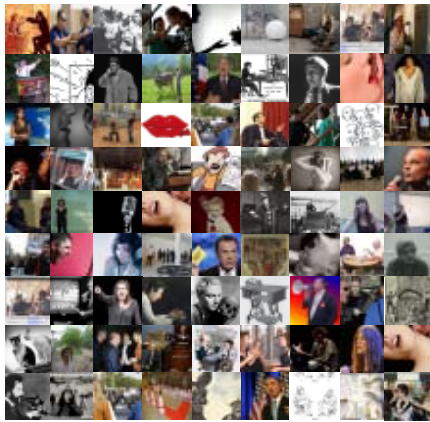
Encyclopédie de la parole Collection (17/02/2011)

A partir d'une sélection d'enregistrements sonores, le collectif l'Encyclopédie de la parole propose une pièce sonore d'un côté et de l'autre, un travail d'analyse selon différentes entrées (correspondant à des phénomènes particuliers de la parole : cadences, choralités, compressions, emphases, espacements, mélodies, répétitions, résidus, saturations, timbres, etc.) qui prendra la forme d'une séance d'écoute réalisée par David Christoffel et d'annotations dispersées dans l'espace d'exposition.