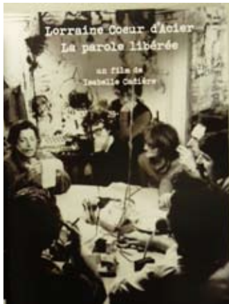
Radio Lorraine Coeur d'Acier, Affiche du film, 2009.