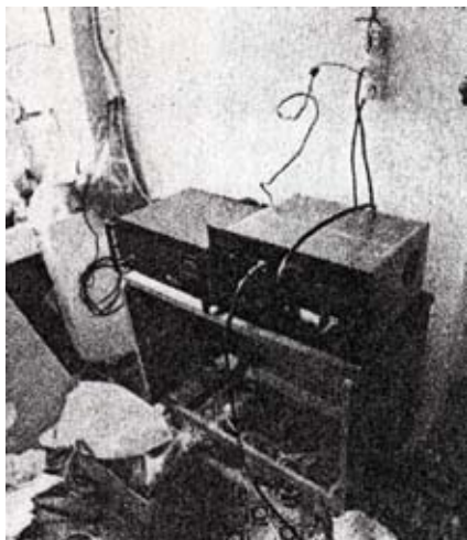
Émetteur de la radio Gilda après sa saisie

L'histoire relatée dans l'ouvrage de Thierry Lefebvre intitulé La Bataille des radios libres : 1977-1981 sera visualisée par le biais d'une frise chronologique placée dans l'espace d'exposition. Retraçant les moments clés d'une période capitale de l'histoire de la radio, cette frise se nourrira de documents comprenant des affiches, des photographies, des articles de presse, des extraits sonores et des agrandissements de certaines pages du livre. Le parcours proposé sera agrémenté d'une vidéo documentaire des frères Dardenne aussi bien que par une série de commentaires et d'explications fournies par plusieurs intervenants issus du monde de la radio ou d'ailleurs.