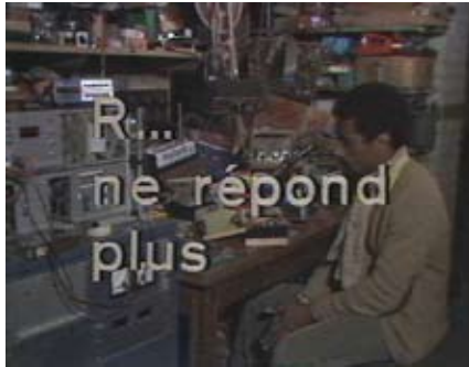
R...ne répond plus, Luc & Jean-Pierre Dardenne, 1981, BE, vidéo, vo fr non sous-titré, 52'

Pour l'exposition Eldorado sera présenté le film R...ne répond plus , documentaire réalisé en 1981 par les frères Dardenne : durant trois mois, les frères Dardenne ont mené une enquête sur sept radios libres en Europe. Ce vidéo-essai, entre réel et fiction, traduit une volonté d'interroger la réalité à partir des ambivalences du médium. Dans le titre, "R" doit être entendu comme le réel. Ils ne pensent pas que la radio libre puisse donner une parole qui aurait du sens au point d'en changer la société.