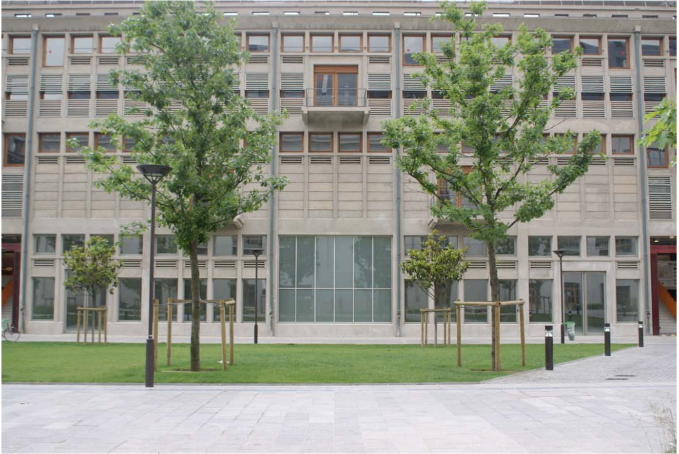
Facade of Bétonsalon