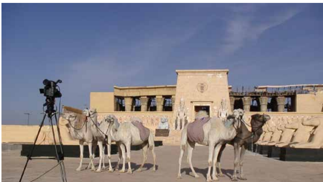
Karthik Pandian, Atlas , 2012, photogramme de la production d'une vidéo HD.

« Dans le monde, je me trouve attiré vers une matière qui est «attelée», parfois de façon comique et parfois de façon tragique, aux convulsions perverses de l'histoire. Invariablement, cela implique une sorte de va-et-vient vibrant et incessant entre le passé et le présent, l'enterré et le respirant. J'ai cependant situé mon travail à l'intervalle de cette pulsation lumineuse – le seuil dans lequel l'historique et le contemporain se hantent mutuellement [...].