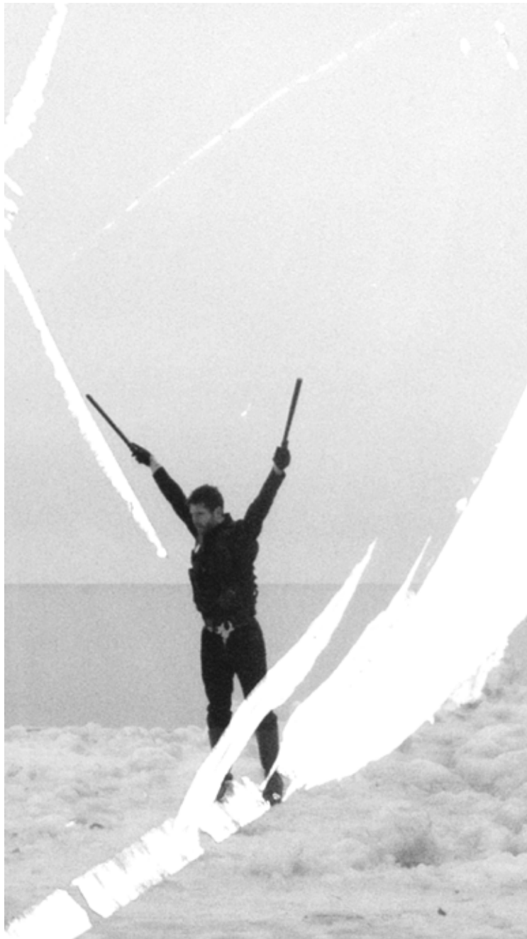
Karthik Pandian, Chrysalis , 2014, photogramme de vidéo HD.

Le papillon dans sa chrysalide est non seulement aveuglé mais également suspendu, en apesanteur. J'imagine que c'est une expérience qui n'est pas totalement éloignée de la sensation enivrante du flottement, qui est quelque chose que j'ai fait au lieu d'aller dans mon atelier. Les films sur lesquels je travaille ressemblent à un cinéma en puissance – éternel, infini, désincarné. Un effort pour accumuler au lieu d'étendre l'intensité. Une tentative de communier avec la négativité pure qui nous rapproche peut-être de notre être. La plus pure lumière est la lumière imaginée, celle qui émane de notre conscience, projetée dans le vide [...].