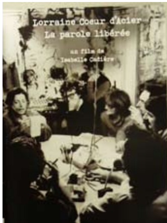
Radio Lorraine Coeur d'Acier, Affiche du film, 2009.