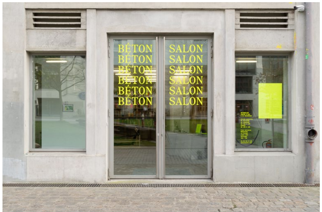
Vue du centre d'art, Image: Bétonsalon.

Bétonsalon est une organisation à but non lucratif établie en 2003. Implanté au sein de l'Université de Paris dans le 13 e arrondissement depuis 2007, Bétonsalon est le seul centre d'art labélisé situé dans une université en France.