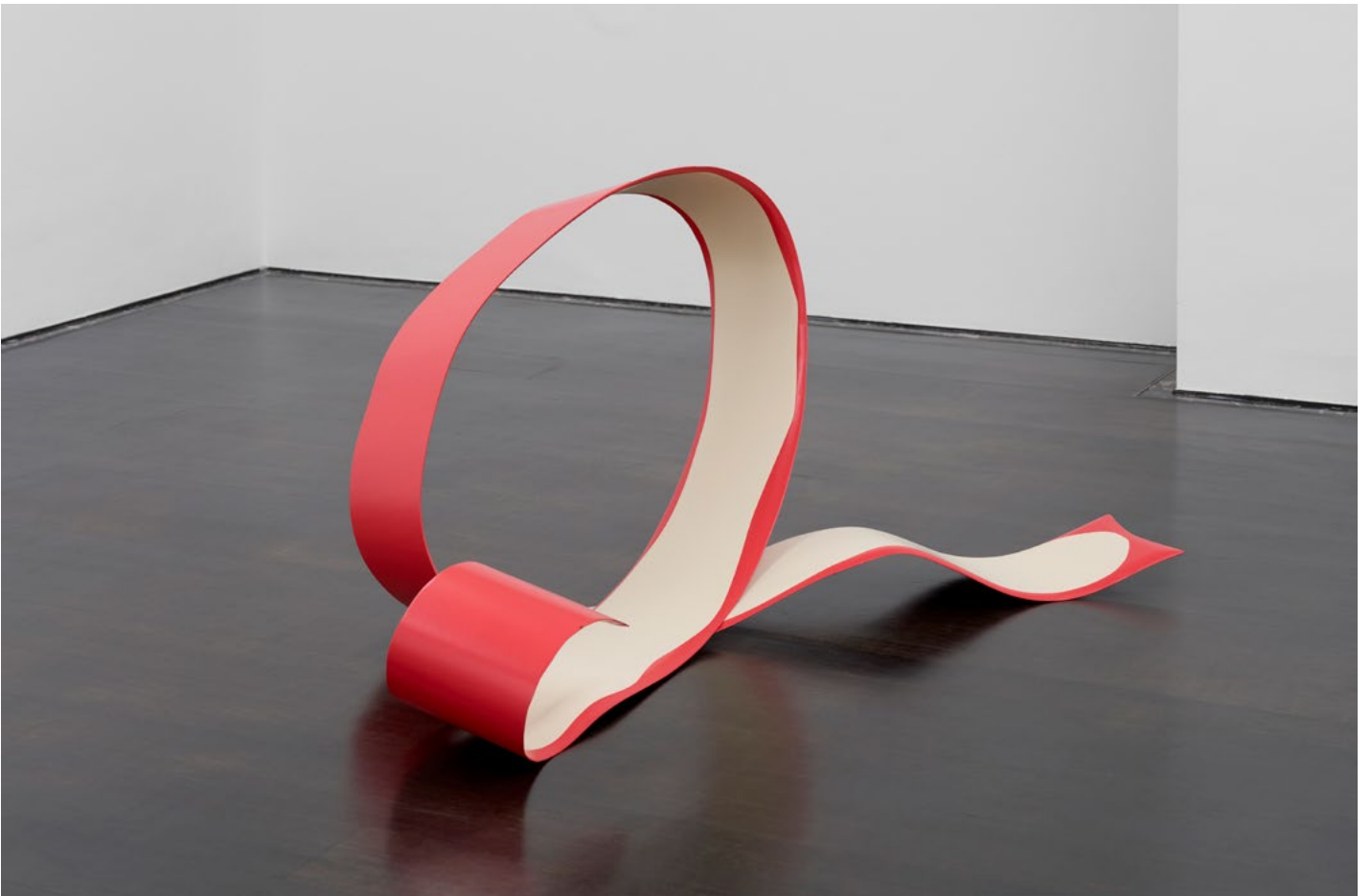
Judith Hopf, Rest (Apple peel 2), 2021. Contreplaqué peint, 77× 158× 125 cm.