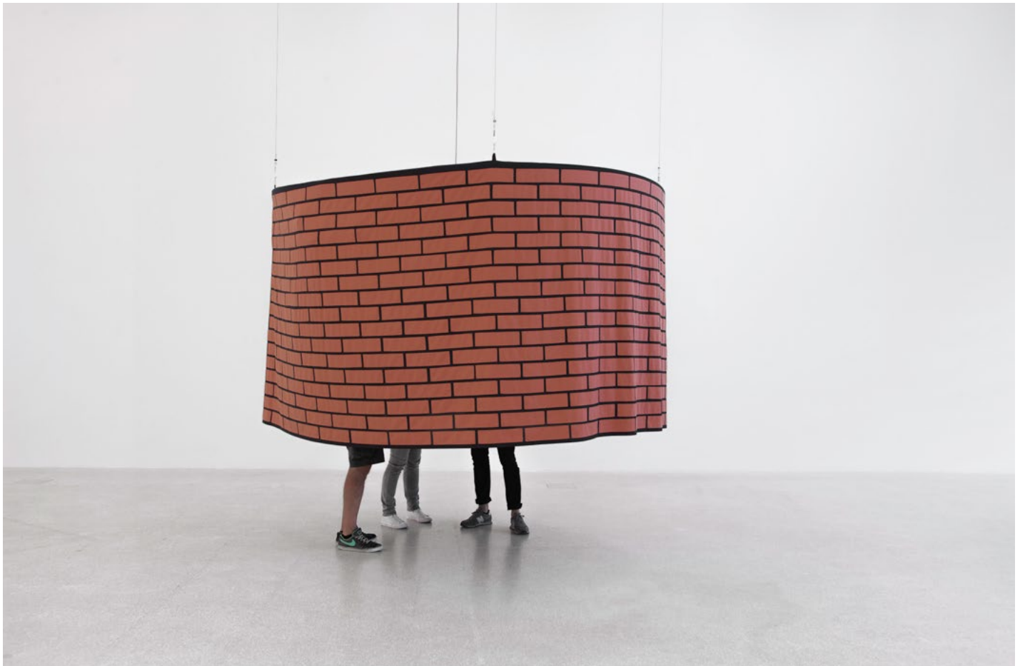
Judith Hopf, Flying Cinema Brickstone Tent, 2016. Tissu, 300 x 300 cm. Vue de l'exposition Up, Museion, Bolzano, 2016. Photo: Luca Meneghel © Adagp, Paris, 2022/ Judith Hopf. Courtesy de l'artiste, de Deborah Schamoni et kaufmann repetto