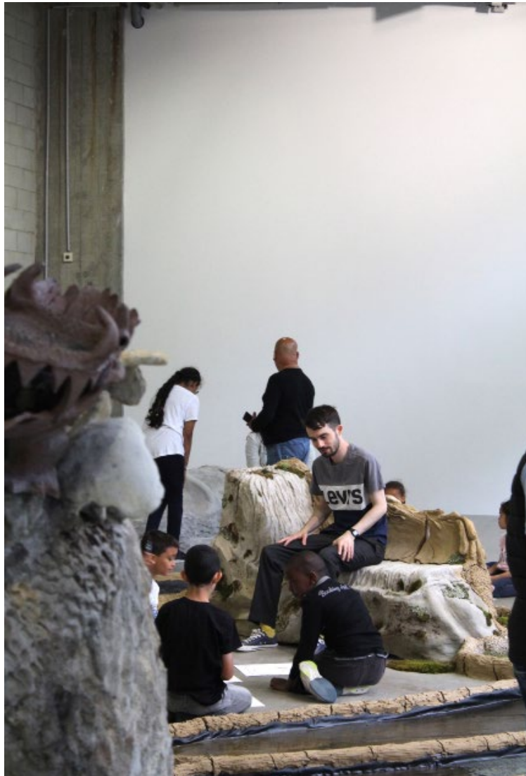
Visite atelier de l'exposition Soupe Primordiale de Tiphaine Calmettes avec l'École élémentaire Louise Bourgeois (Paris, 13e), Bétonsalon - centre d'art et de recherche, Paris, 2022. Co-produite par AWARE : Archives of Women Artists, Research and Exhibitions, pour le prix 2020. © Adagp, Paris, 2022.

● Les matières, les techniques et les formes, l'artiste, les lieux de l'art; Appréhender les phénomènes artistiques d'aujourd'hui à la lumière de l'évolution des arts, des techniques et des sociétés des siècles passés; Éducation de la sensibilité et analyse d'œuvre.