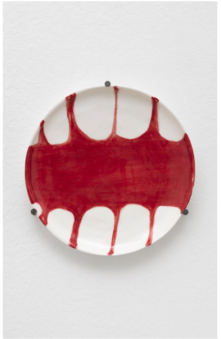
Judith Hopf, Untitled, 2021. C ramique  maill e,   29,5 cm.   Adagp, Paris, 2022/ Judith Hopf. Courtesy de l'artiste, de Deborah Schamoni et kaufmann repetto