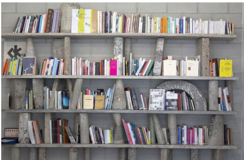
Romain Grateau, Grand tourisme à injection , 2021

Séance d'arpentage collectif autour de l'ouvrage de Zetkin Collective, Fascisme fossile. L'extrême droite, l'énergie, le climat , coord. Andreas Malm (2020) à Bétonsalon