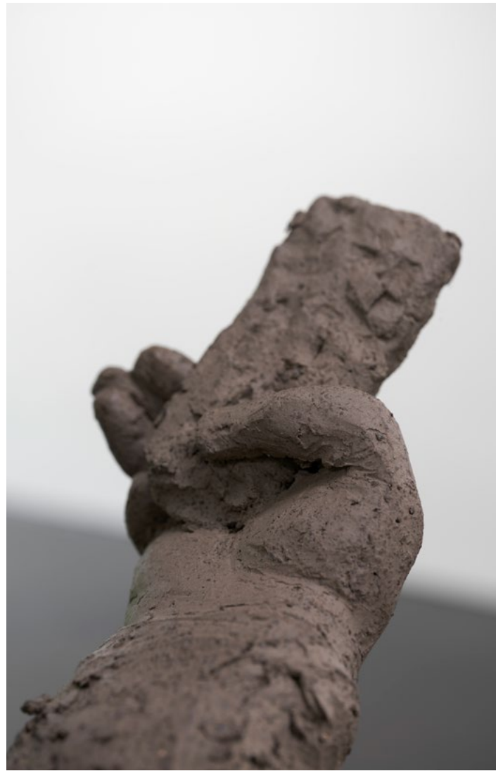
Judith Hopf, Phone User 4, 2021. Terre cuite, socle en béton, 173x 44x 58 cm. Photo: Ulrich Gebert © Adagp, Paris, 2022/ Judith Hopf. Courtesy de l'artiste, de Deborah Schamoni et kaufmann repetto