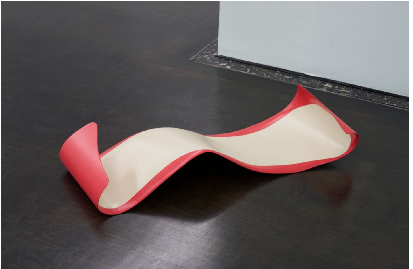
Judith Hopf, Rest (Apple peel 2) , 2021 Contreplaqué peint, 77 x 158 x 125 cm.