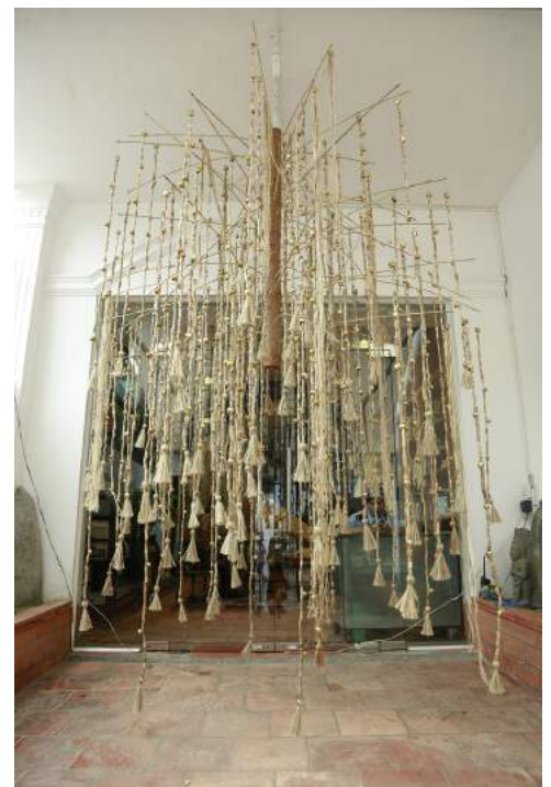
Thao-Nguyen Phan, Untitled (Heads) de la série Uproot Rice, Grow Jute , 2013.