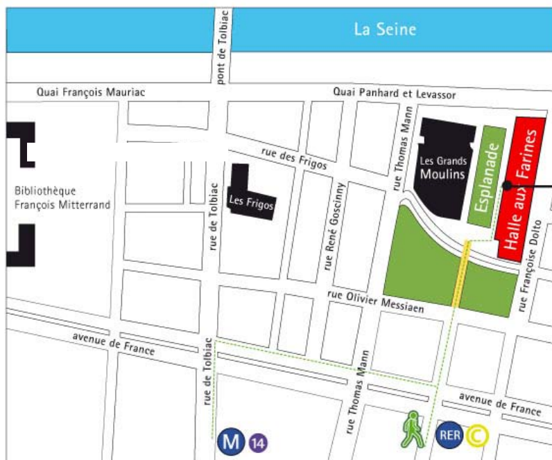
Métro Ligne 14 ou RER C, Arrêt Bibliothèque François Mitterrand