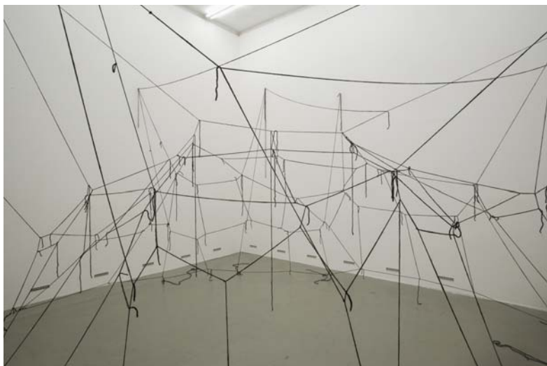
Michaël Höpfner On Foot (2009) Tent structure Galerie Hubert Winter, Vienne. Copyright: Michael Höpfner