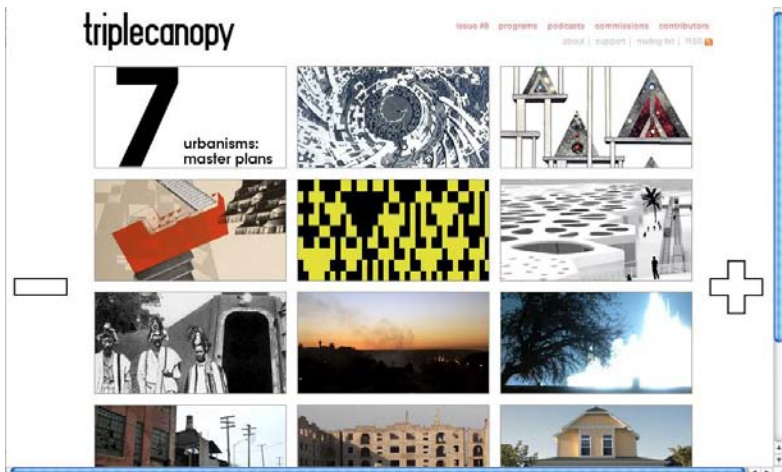
Tripe Canopy Capture d'écran de Triple Canopy #7