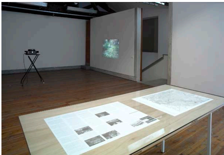
Lara Almarcegui Wastelands Map Amsterdam, guide to the empty sites of Amsterdam (1999) Projection de quarante diapositives, deux cartes (recto-verso) de terrains vagues. Dimensions : variables Collection Frac Bourgogne.