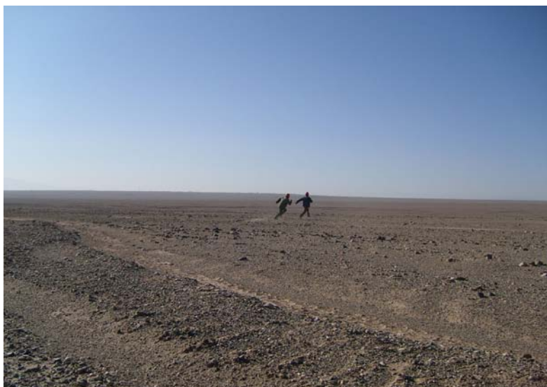
Wang Bing Crude Oil (2008) Film Copyright: Wang Bing