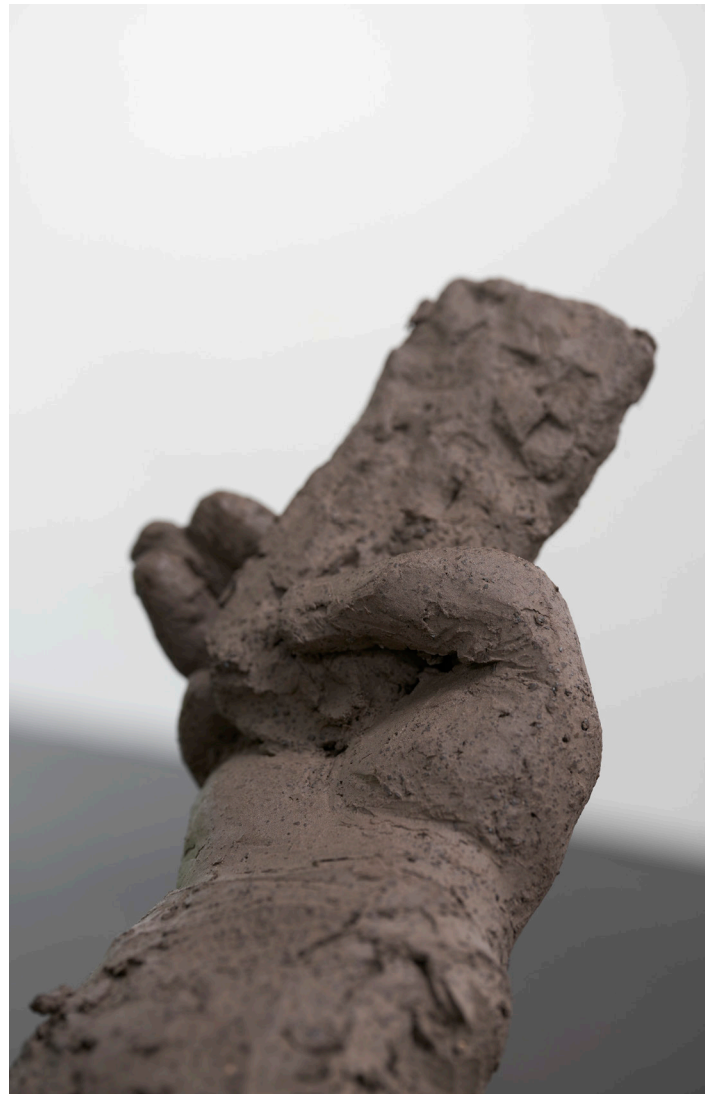
Judith Hopf, Phone User 4, 2021. Terre cuite, socle en béton, 173x 44x 58 cm.