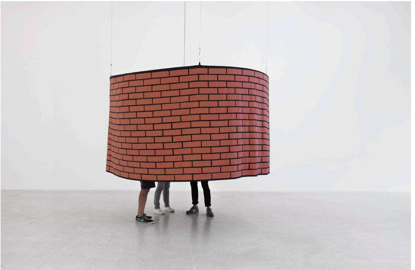
Judith Hopf, Flying Cinema Brickstone Tent, 2016. Tissu, 300 x 300 cm. Vue de l'exposition Up, Museion, Bolzano, 2016.