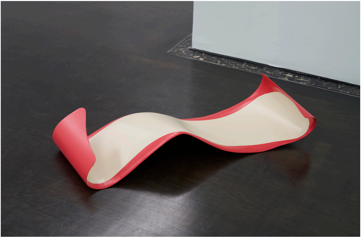
Judith Hopf, Rest (Apple peel 2) , 2021 Contreplaqué peint, 77 x 158 x 125 cm.