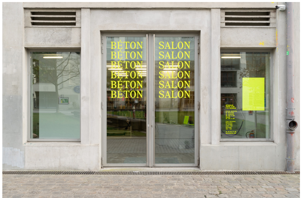
Vue du centre d'art, Image: Bétonsalon.

Bétonsalon est une organisation à but non lucratif établie en 2003. Implanté au sein de l'Université de Paris dans le 13 e arrondissement depuis 2007, Bétonsalon est le seul centre d'art labellisé situé dans une université en France.