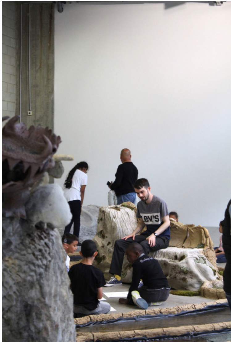
Visite atelier de l'exposition Soupe Primordiale de Tiphaine Calmettes avec l'École élémentaire Louise Bourgeois (Paris, 13e), Bétonsalon - centre d'art et de recherche, Paris, 2022. Co-produite par AWARE : Archives of Women Artists, Research

● Les matières, les techniques et les formes, l'artiste, les lieux de l'art; Appréhender les phénomènes artistiques d'aujourd'hui à la lumière de l'évolution des arts, des techniques et des sociétés des siècles passés; Éducation de la sensibilité et analyse d'œuvre.