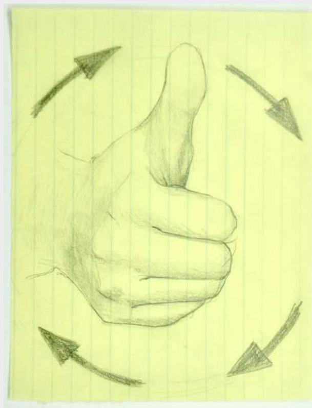
← Audrey Prédhumeau, Entre épines et pistils – Sur son flanc, l'oiseau est endormi aux côtés de ses deux sœurs jumelles , 2022, boîtes en carton, fourrure, plâtre, cire, vue d'installation et Hélène Janicot, Thumb/tomb , 2023, dessin sur papier, 21 x 29,7 cm.