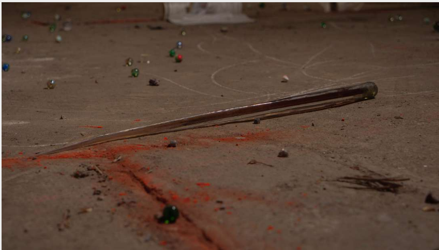
← Juliette Ayrault, Sans titre , 2023, billes, maquettes, pastels et matériaux de récupération, dimensions variables, Vues de l'exposition Fungi Imperfecti, Nanterre, 2023