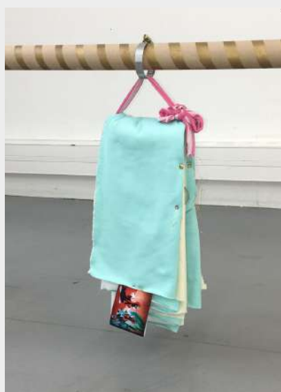
« Nina Azoulay, Constance , 2023, tissu, carton, fil, métal, sequins, impression sur papier.