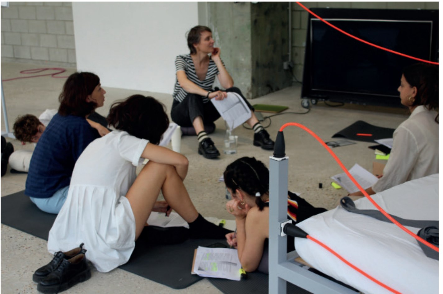
Vue de l'exposition « Un-Tuning Together. Pratiquer l'écoute avec Pauline Oliveros » au cours d'une séance de traduction de Quantum Listening de Pauline Oliveros, Bétonsalon – centre d'art et de recherche, Paris, septembre 2023.