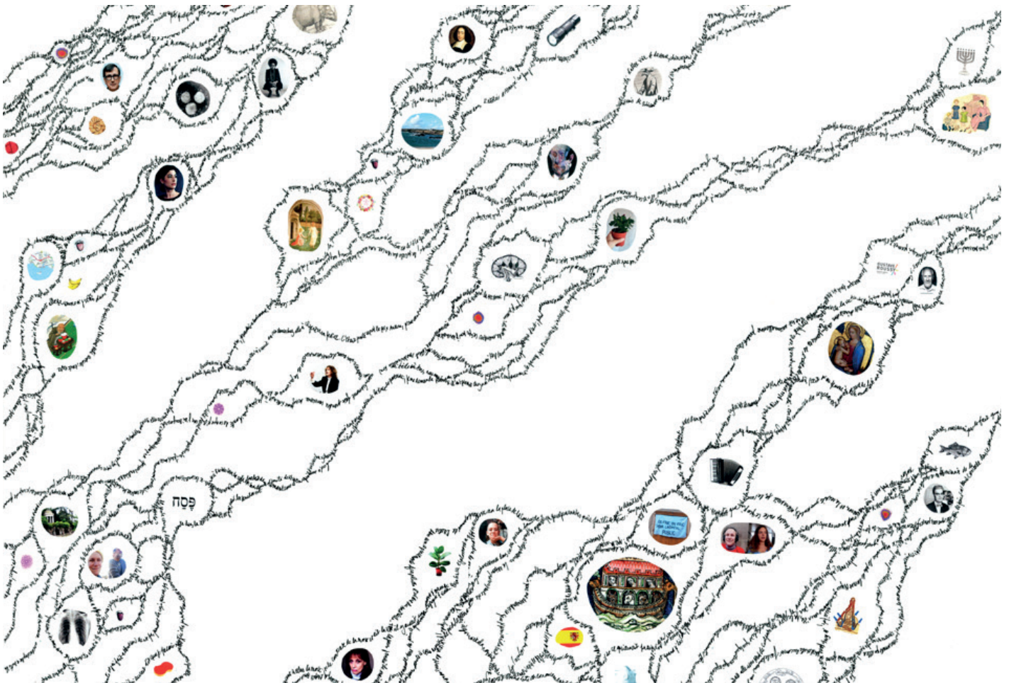
Violaine Lochu, Futur Intérieur (détail), 2020, série de trois dessin 50x65 cm, encre et collage, Production AWARE et CNAP, Paris. © Violaine Lochu / Adagp, Paris 2023.