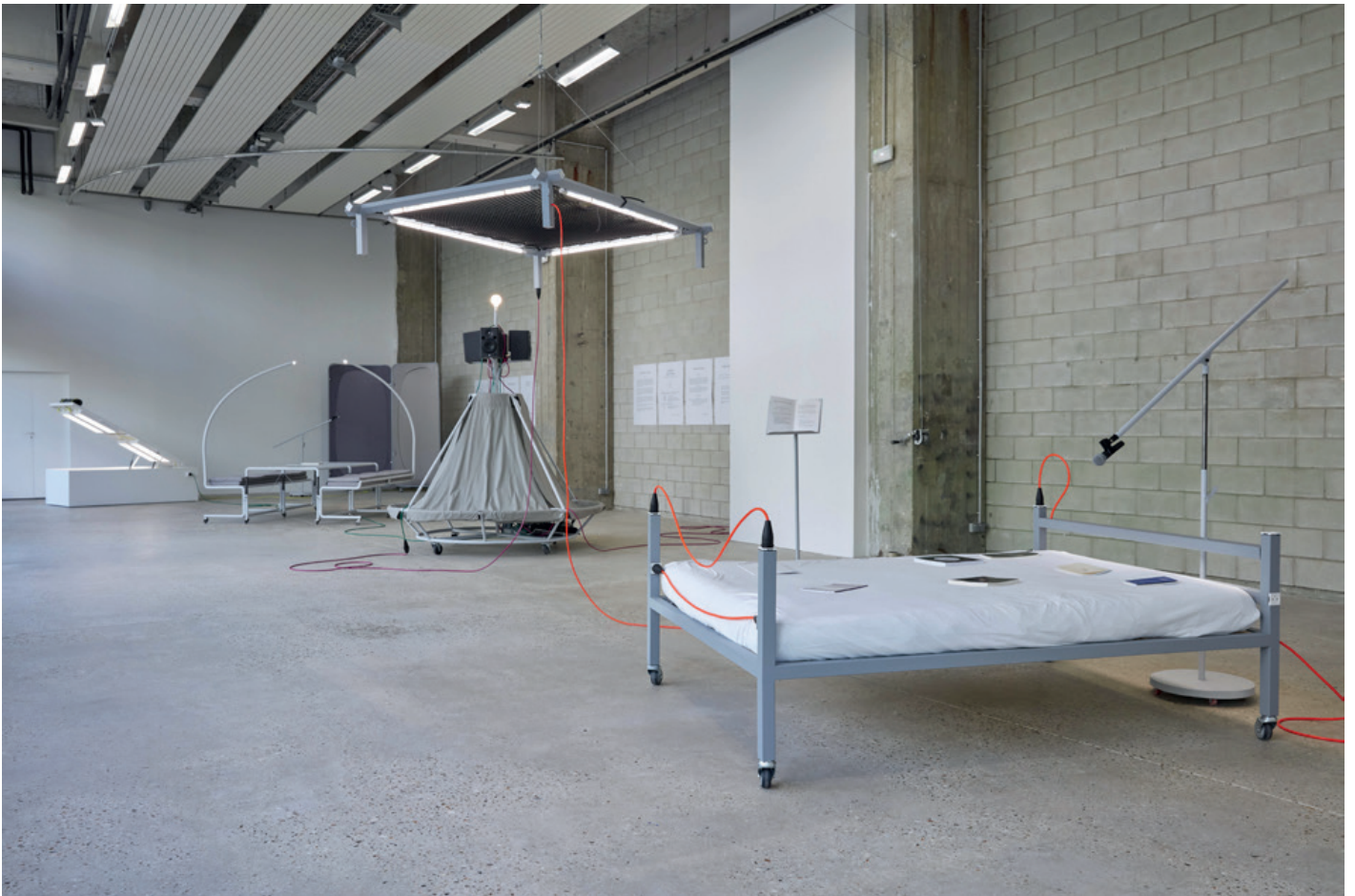
Vue de l'exposition « Un·Tuning Together. Pratiquer l'écoute avec Pauline Oliveros » Avec les œuvres de Konstantinos Kyriakopoulos et les partitions de Pauline Oliveros, Bétonsalon – centre d'art et de recherche, Paris, 2023.