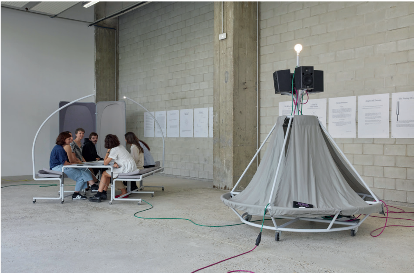
Vue de l'exposition « Un·Tuning Together. Pratiquer l'écoute avec Pauline Oliveros » Avec les œuvres de Konstantinos Kyriakopoulos et les partitions de Pauline Oliveros, Bétonsalon – centre d'art et de recherche, Paris, 2023.

↳ Vernissage de l'installation : vendredi 22 septembre, de 16h à 21h. Visible jusqu'au 2 décembre.