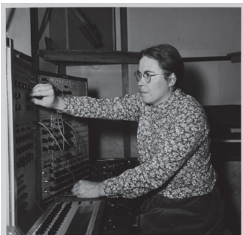
Pauline Oliveros dans le studio du Tape Music Center à San Francisco avec un synthétiseur Buchla 100, 1966.