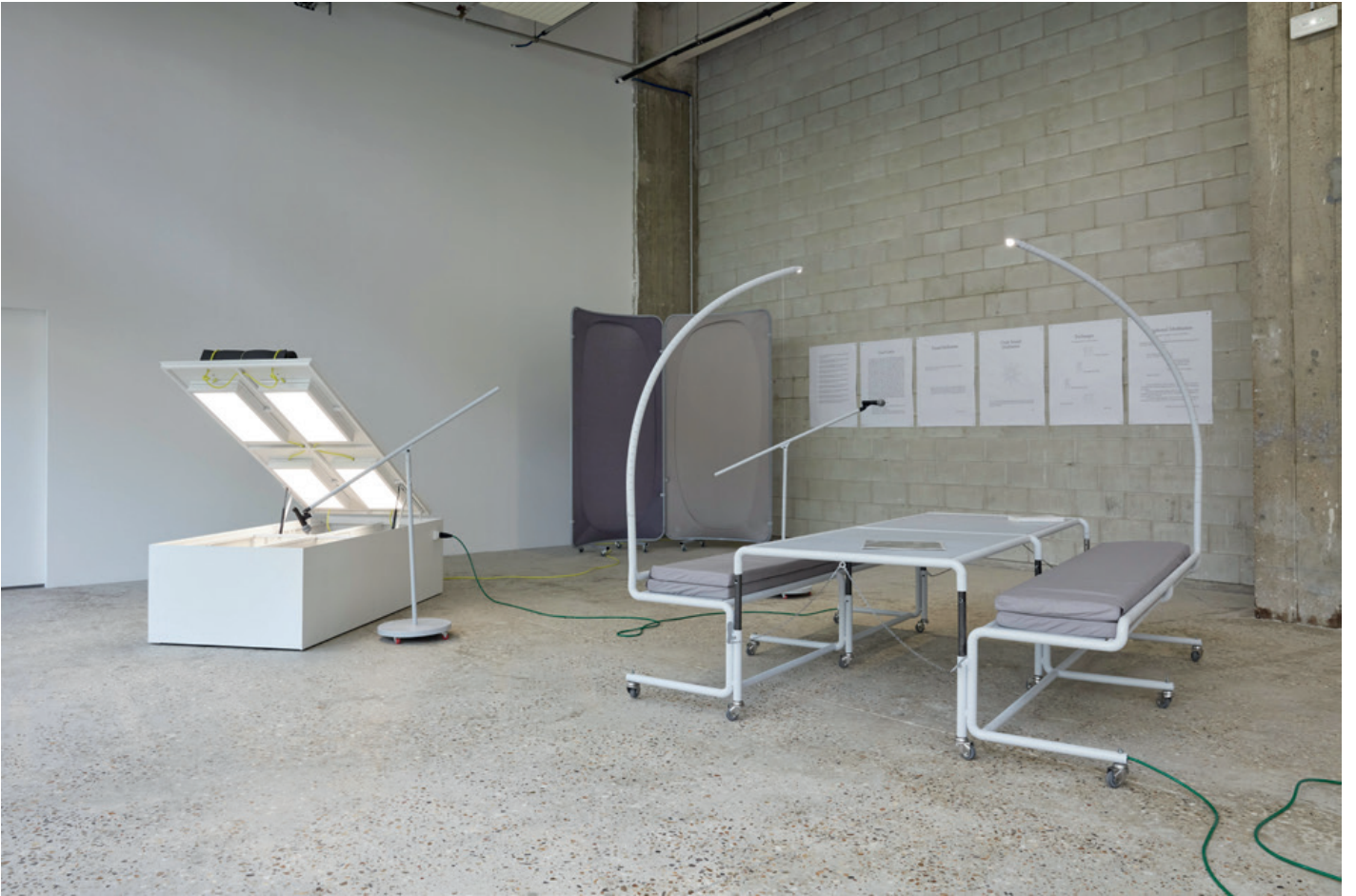
Vue de l'exposition « Un·Tuning Together. Pratiquer l'écoute avec Pauline Oliveros » Avec les œuvres de Konstantinos Kyriakopoulos et les partitions de Pauline Oliveros, Bétonsalon – centre d'art et de recherche, Paris, 2023.