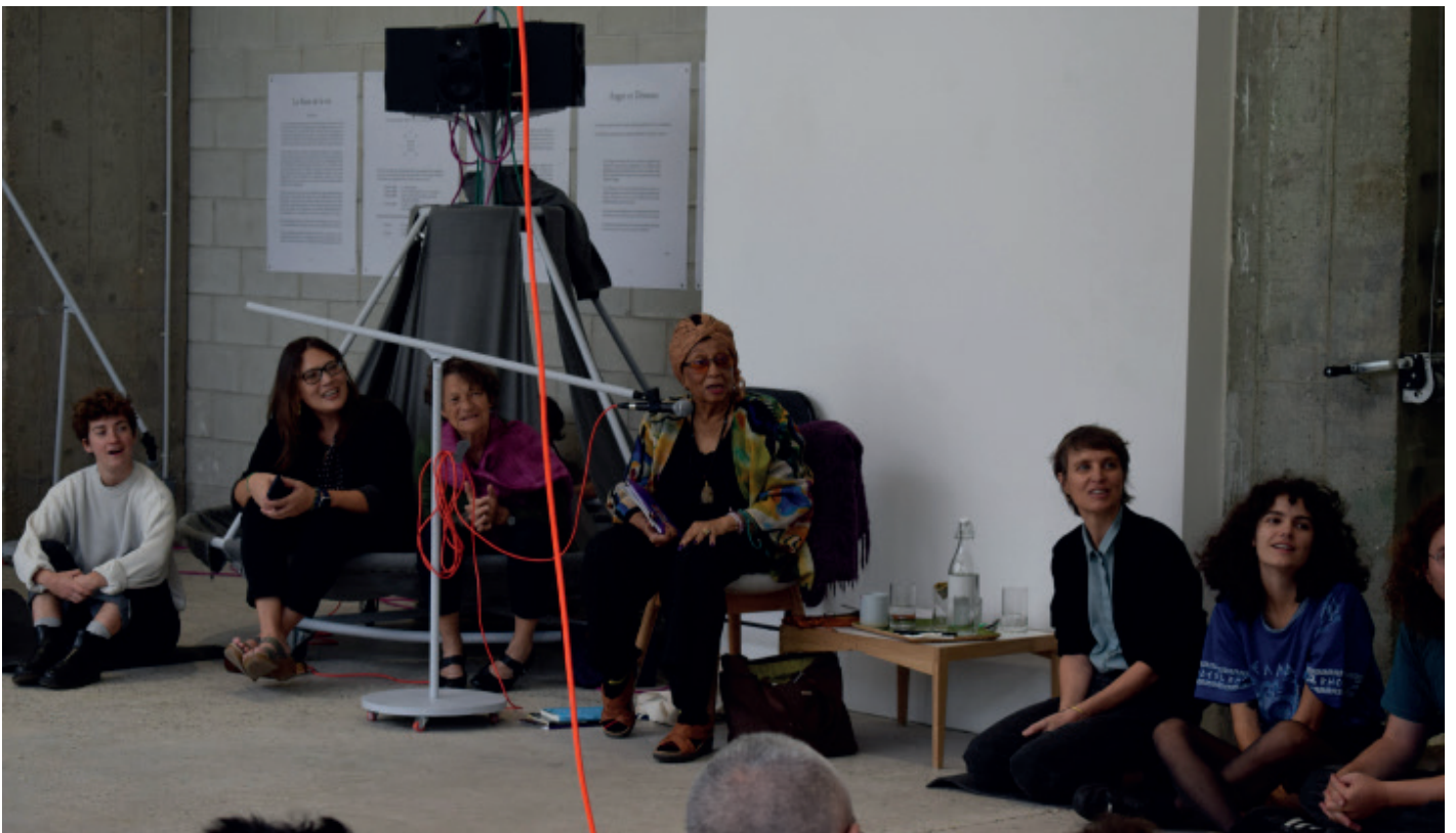
IONE au cours d'une séance d'initiation au Deep Listening , Bétonsalon - centre d'art et de recherche, Paris, septembre 2023.