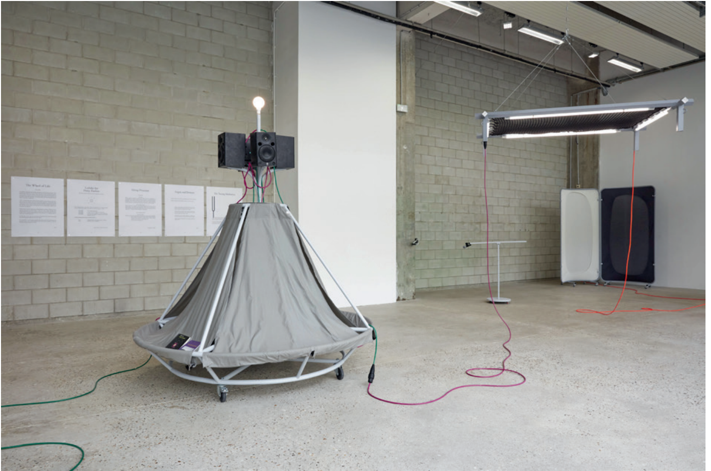
Vue de l'exposition « Un-Tuning Together. Pratiquer l'écoute avec Pauline Oliveros » Avec les œuvres de Konstantinos Kyriakopoulos et les partitions de Pauline Oliveros, Bétonsalon – centre d'art et de recherche, Paris, 2023.