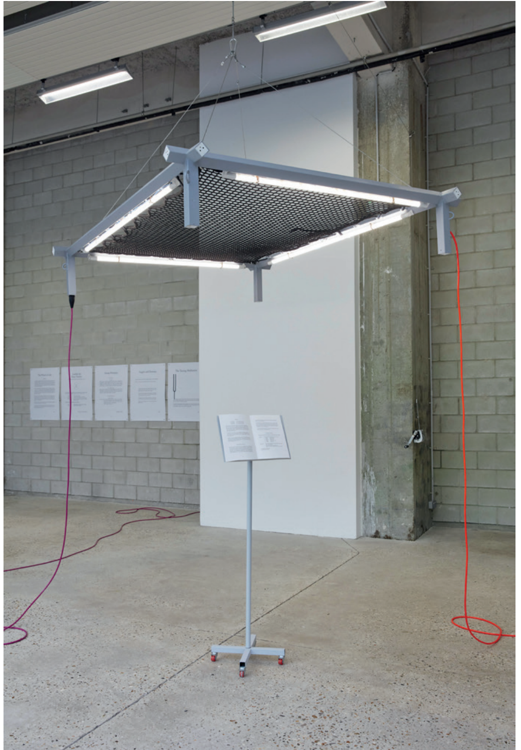
Vue de l'exposition « Un·Tuning Together. Pratiquer l'écoute avec Pauline Oliveros » Avec les œuvres de Konstantinos Kyriakopoulos et les partitions de Pauline Oliveros, Bétonsalon – centre d'art et de recherche, Paris, 2023.