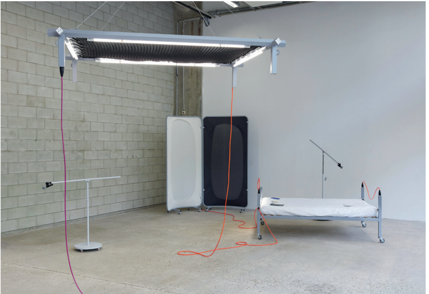
Vue de l'exposition « Un·Tuning Together. Pratiquer l'écoute avec Pauline Oliveros » Avec les œuvres de Konstantinos Kyriakopoulos et les partitions de Pauline Oliveros, Bétonsalon – centre d'art et de recherche, Paris, 2023.