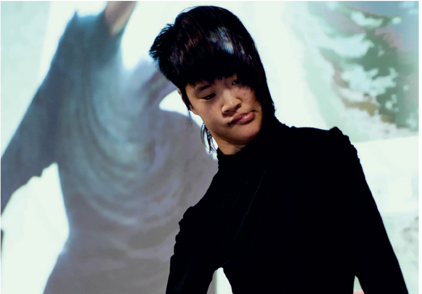
Portrait de No Anger.

↳ Laboratoire Espace Cerveau - Station 24 : vendredi 24 et samedi 25 novembre, de 14h à 18h30 en partenariat avec l'IAC Villeurbanne