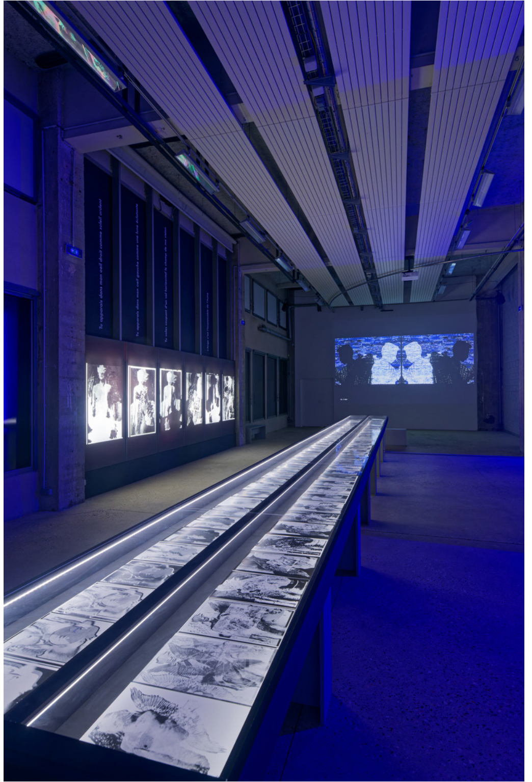
Vue de l'exposition «J'accède à l'Ange par ton extase» de Klonaris/Thomadaki, Bétonsalon - centre d'art et de recherche, Paris, 2024 © Klonaris/Thomadaki / ADAGP, Paris, 2024.