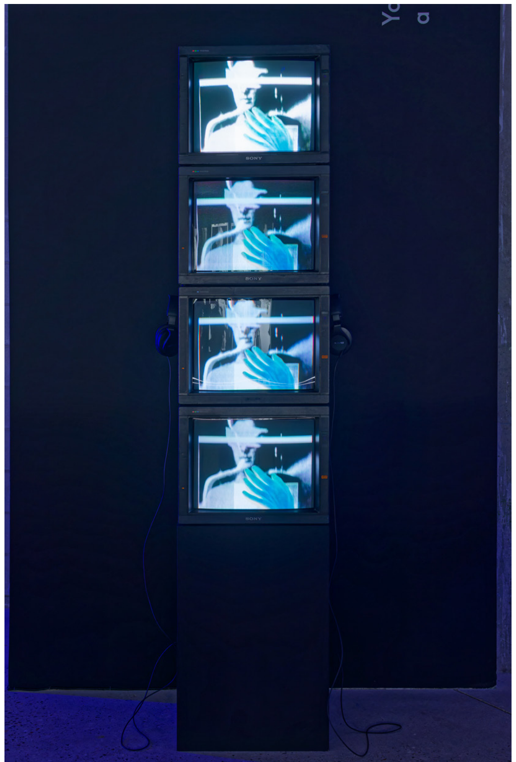
Vue de l'exposition «J'accède à l'Ange par ton extase» de Klonaris/Thomadaki, Vue de Personal Statement, 1994, Vidéo analogique du Cycle de l'Ange , Bétonsalon - centre d'art et de recherche, Paris, 2024 © Klonaris/Thomadaki / ADAGP, Paris, 2024.