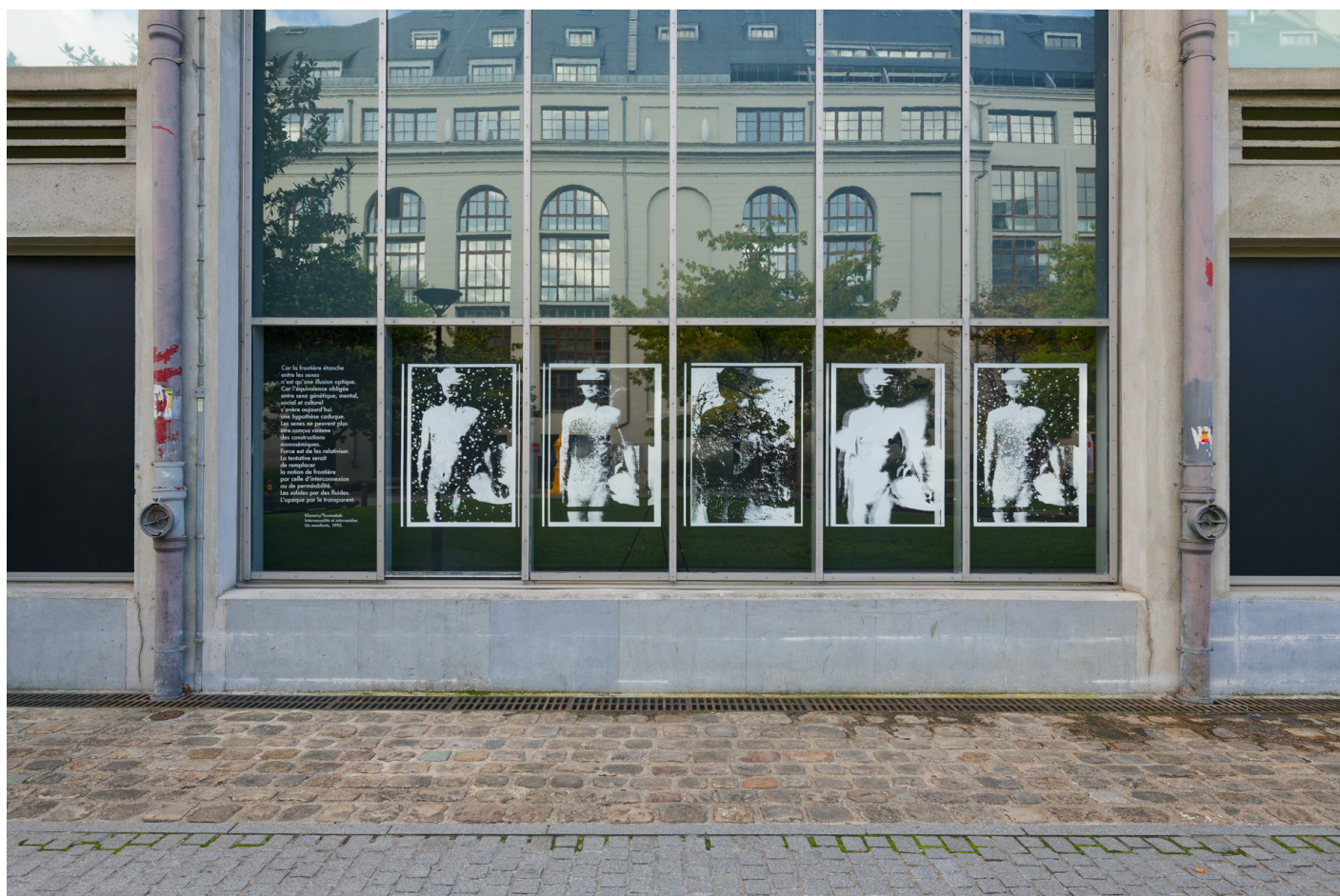
Vue de l'exposition «J'accède à l'Ange par ton extase» de Klonaris/Thomadaki, Vue de Manifeste , 2024, Séquences photographiques, Bétonsalon - centre d'art et de recherche, Paris, 2024 © Klonaris/Thomadaki / ADAGP, Paris, 2024.