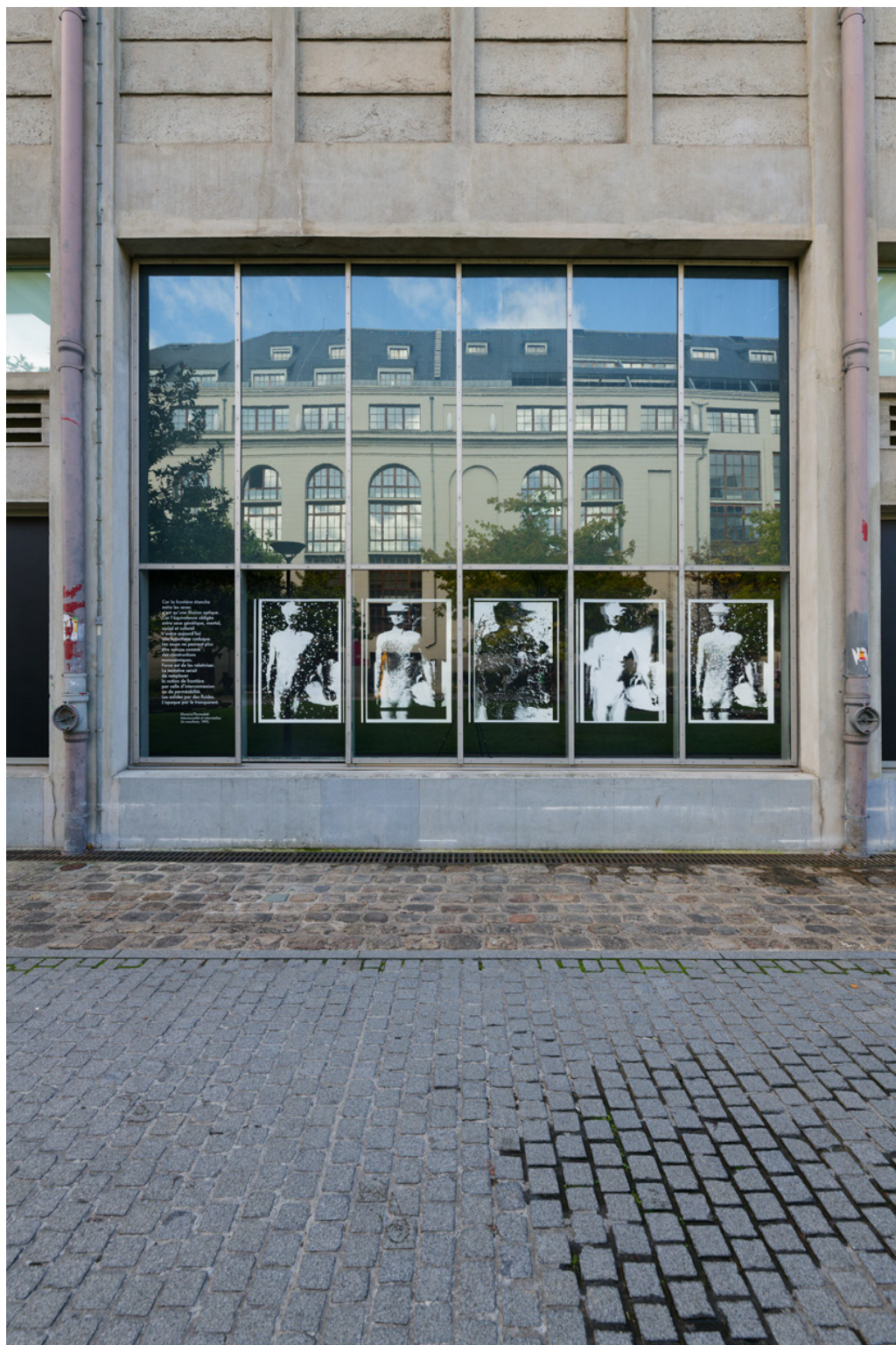
Vue de l'exposition «J'accède à l'Ange par ton extase» de Klonaris/Thomadaki, Vue de Manifeste , 2024, Séquences photographiques, Bétonsalon - centre d'art et de recherche, Paris, 2024 © Klonaris/Thomadaki / ADAGP, Paris, 2024.