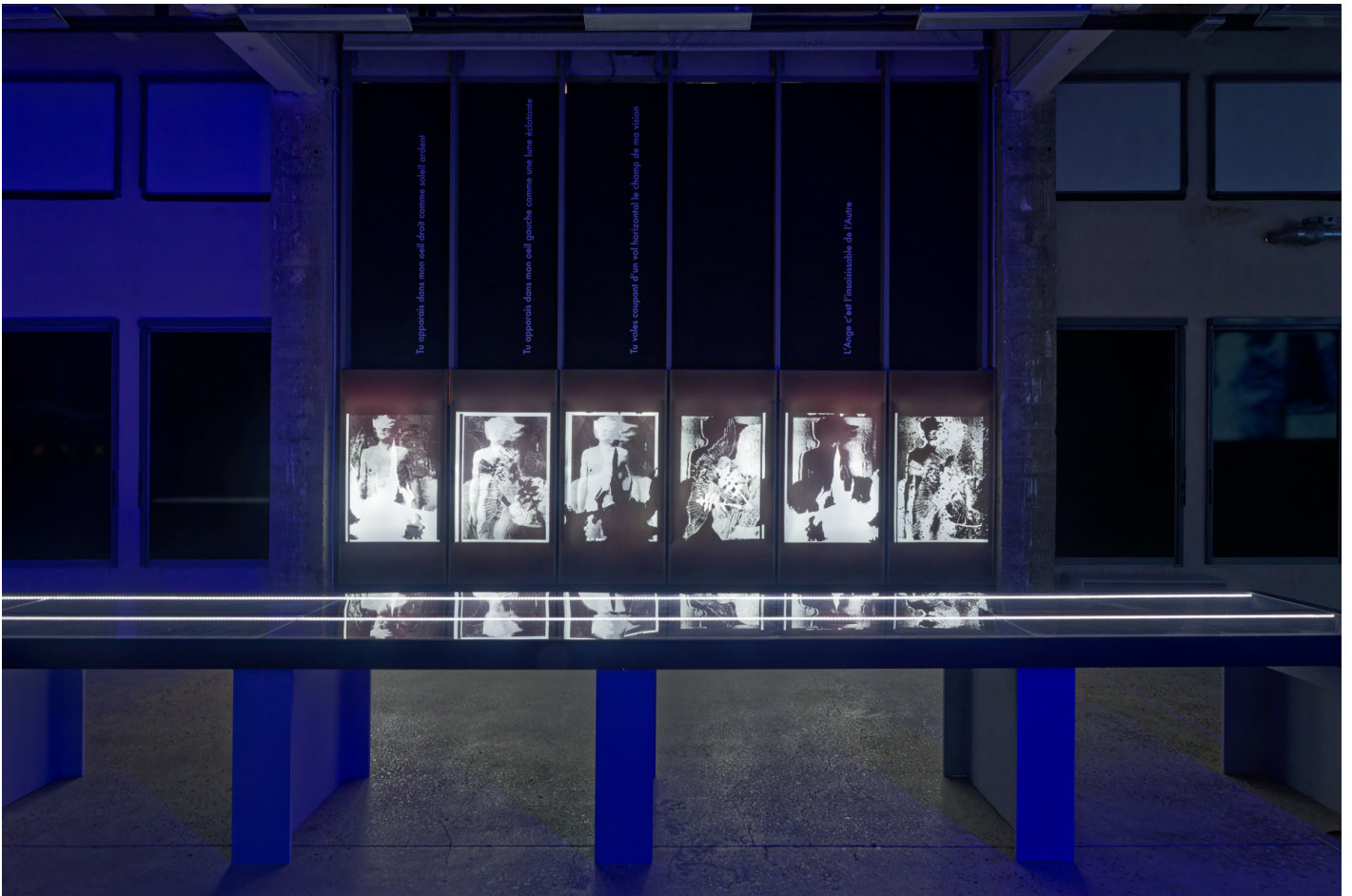
Vue de l'exposition «J'accède à l'Ange par ton extase» de Klonaris/Thomadaki, Vue de Ailes , 2024, Séquences photographiques, Bétonsalon - centre d'art et de recherche, Paris, 2024 © Klonaris/Thomadaki / ADAGP, Paris, 2024.