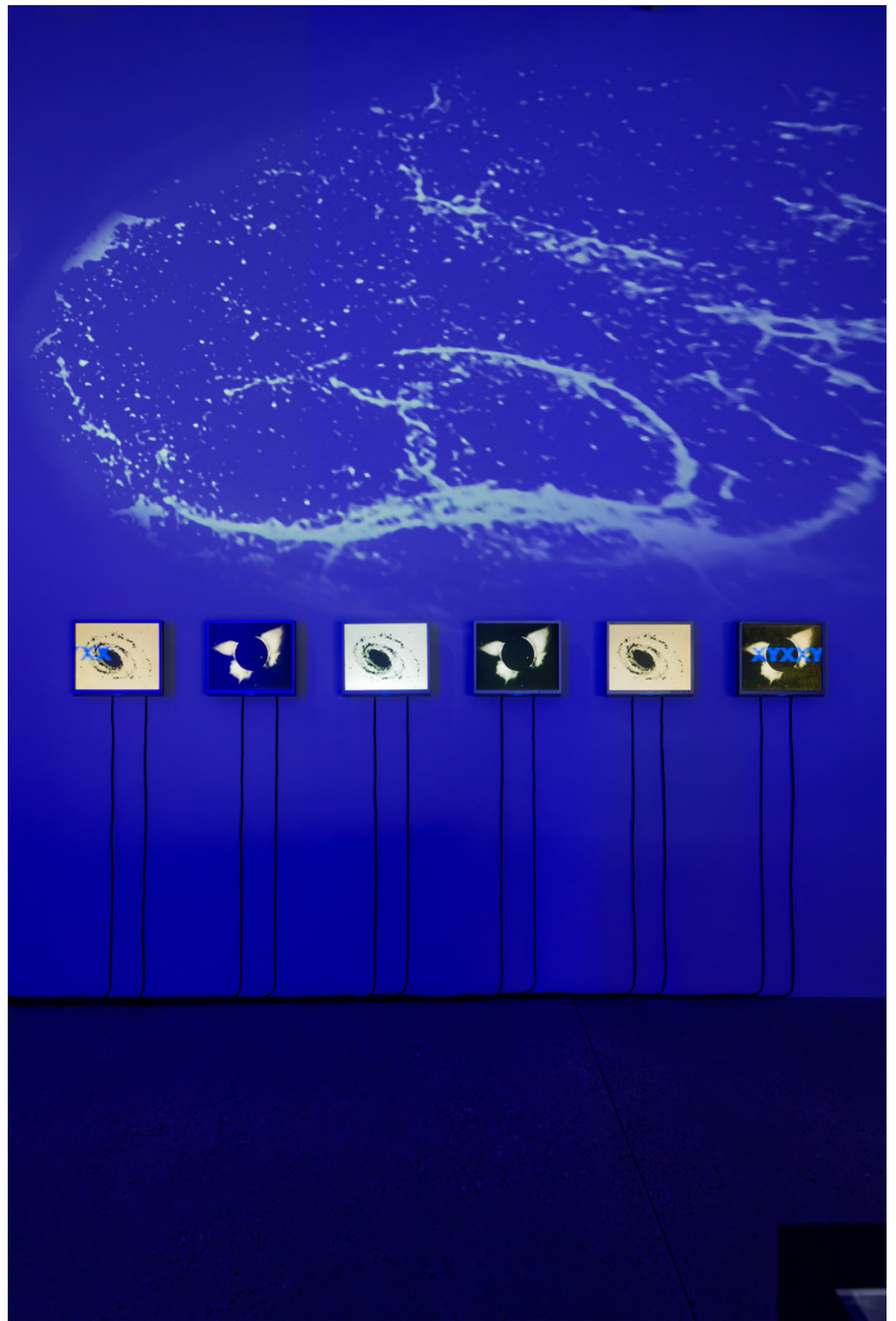
Vue de l'exposition «J'accède à l'Ange par ton extase» de Klonaris/Thomadaki, Vue de XYXX Collapse of Gender , 1994, Vidéo analogique du Cycle de l'Ange , Bétonsalon - centre d'art et de recherche, Paris, 2024 © Klonaris/Thomadaki / ADAGP, Paris, 2024.