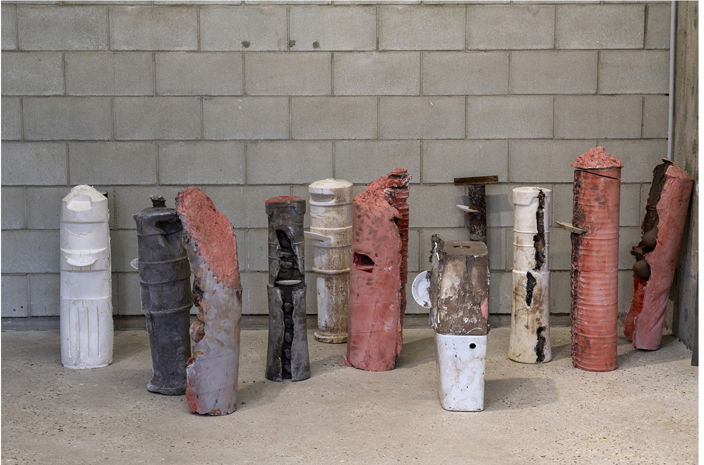
Les enfants délinquants à la naissance , 2024, Potelets, plâtre, métal, assiettes, filasse, pigments, Production Bétonsalon et CEAAC

Vue de l'exposition «SÉCURITÉ SOCIALE PRÉLUDE – Vies institutionnelles» de Florian Fouché, Bétonsalon – centre d'art et de recherche, Paris, 2025.