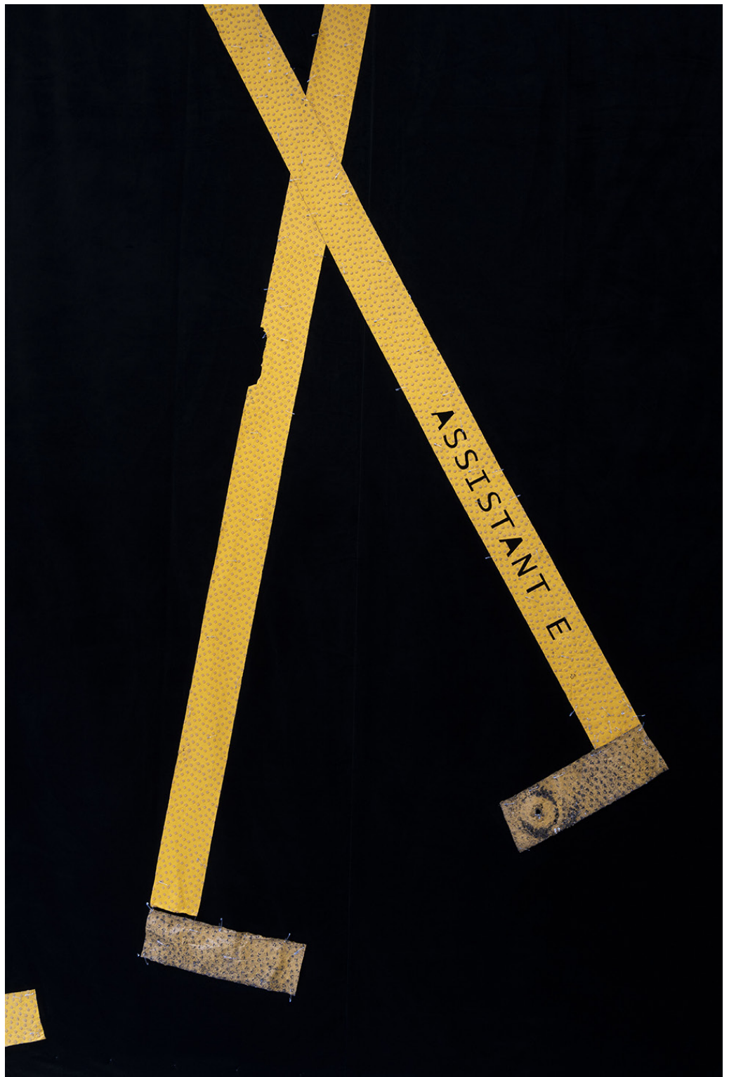
Parking de l'hôpital , 2024, Pendrillon de théâtre en velours, bandes de passage clouté adhésives, épingles à nourrice, Production Bétonsalon Vue de l'exposition «SÉCURITÉ SOCIALE PRÉLUDE – Vies institutionnelles» de Florian Fouché, Bétonsalon – centre d'art et de recherche, Paris, 2025.