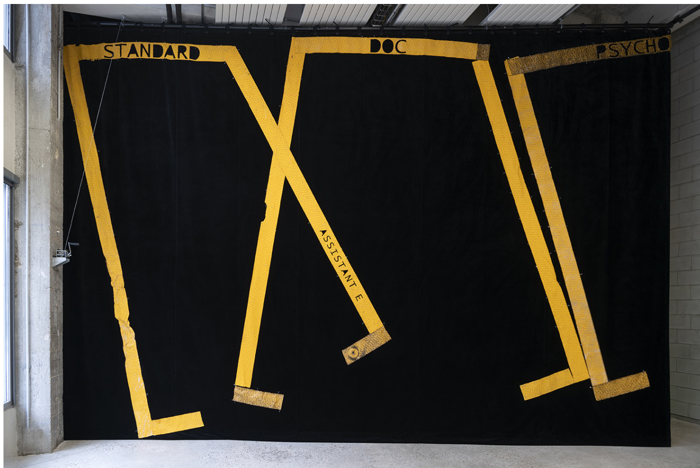
Parking de l'hôpital , 2024, Pendrillon de théâtre en velours, bandes de passage clouté adhésives, épingles à nourrice, Production Bétonsalon Vue de l'exposition «SÉCURITÉ SOCIALE PRÉLUDE – Vies institutionnelles» de Florian Fouché, Bétonsalon – centre d'art et de recherche, Paris, 2025.