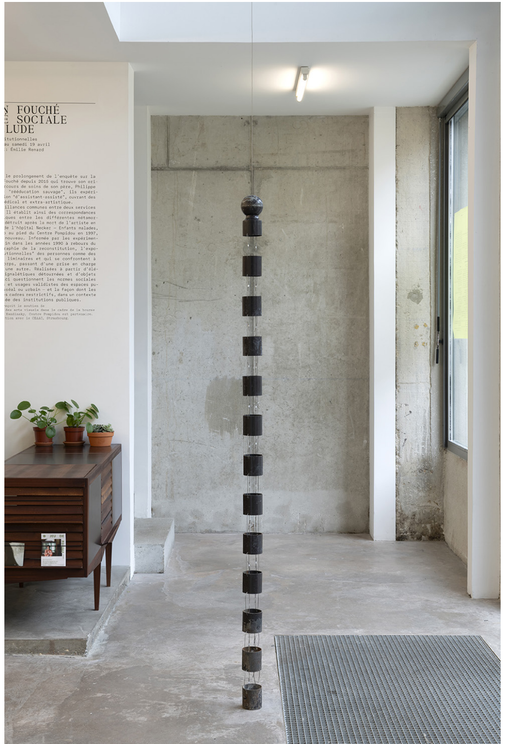
Sculpture non déclarée , 2024, Potelet urbain, câbles Vue de l'exposition «SÉCURITÉ SOCIALE PRÉLUDE – Vies institutionnelles» de Florian Fouché, Bétonsalon - centre d'art et de recherche, Paris, 2025.

À propos de la sculpture des arts visuels dans le cadre de la biennale Kandinsky, Centre Pompidou est partenaire. Avec le CEEAC, Strasbourg.