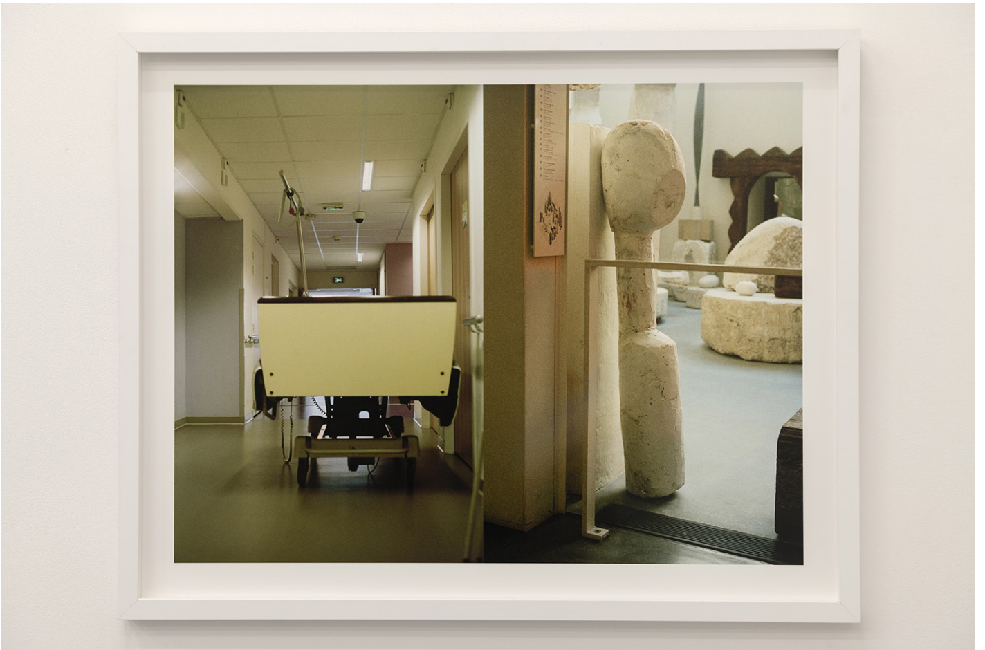
ASSASINS. L'atelier Brâncuși recomposé, 2016, Montage photographique Vue de l'exposition de Florian Fouché, «SÉCURITÉ SOCIALE PRÉLUDE – Vies institutionnelles», Bétonsalon – centre d'art et de recherche, Paris, 2025.