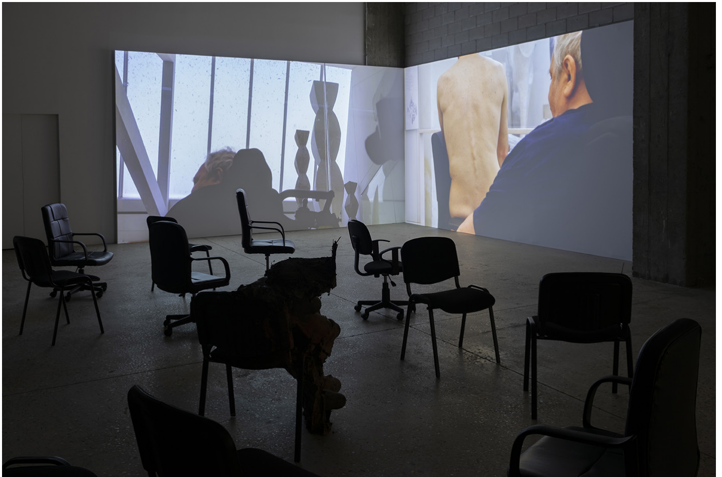
Assistance , 2025, Chaises, fauteuils à roulettes, plâtre, Production CRAC Occitanie et Bétonsalon Vie institutionnelle , 2024, Vidéoprojection sur deux écrans Vue de l'exposition «SÉCURITÉ SOCIALE PRÉLUDE – Vies institutionnelles» de Florian Fouché, Bétonsalon – centre d'art et de recherche, Paris, 2025.