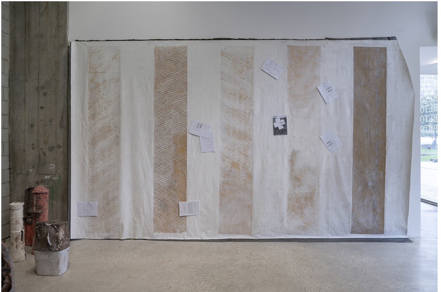
Passage de l'Â.M.E., 2024, Toile de coton, bandes de passages clouté adhésives, tracts, vidéo, 9'35'' Vue de l'exposition «SÉCURITÉ SOCIALE PRÉLUDE – Vies institutionnelles» de Florian Fouché, Bétonsalon – centre d'art et de recherche, Paris, 2025.