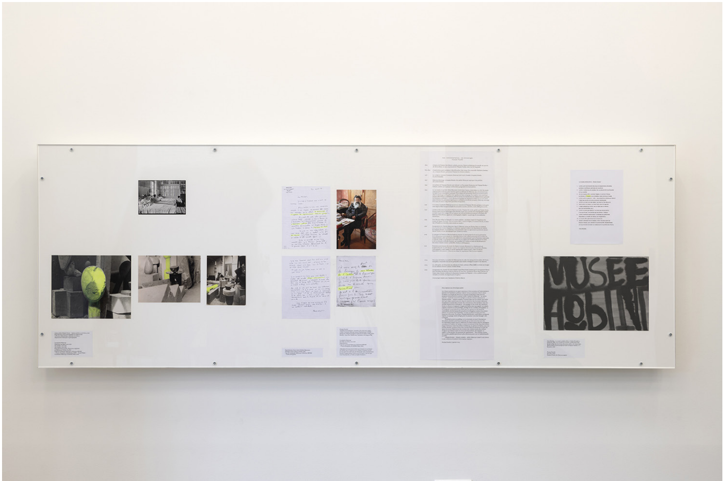
Vitrine assistante-assistée. Vies institutionnelles (Brâncuși / Hôpital Necker - Enfants malades / musée antidote), 2025, Production Bétonsalon Vue de l'exposition «SÉCURITÉ SOCIALE PRÉLUDE – Vies institutionnelles» de Florian Fouché, Bétonsalon - centre d'art et de recherche, Paris, 2025.