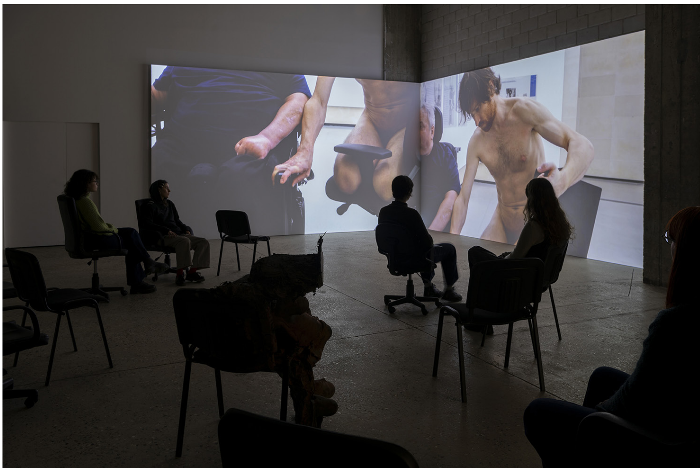
Assistance , 2025, Chaises, fauteuils à roulettes, plâtre, Production CRAC Occitanie et Bétonsalon Vie institutionnelle , 2024, Vidéo-projection sur deux écrans Vue de l'exposition «SÉCURITÉ SOCIALE PRÉLUDE – Vies institutionnelles» de Florian Fouché, Bétonsalon – centre d'art et de recherche, Paris, 2025.