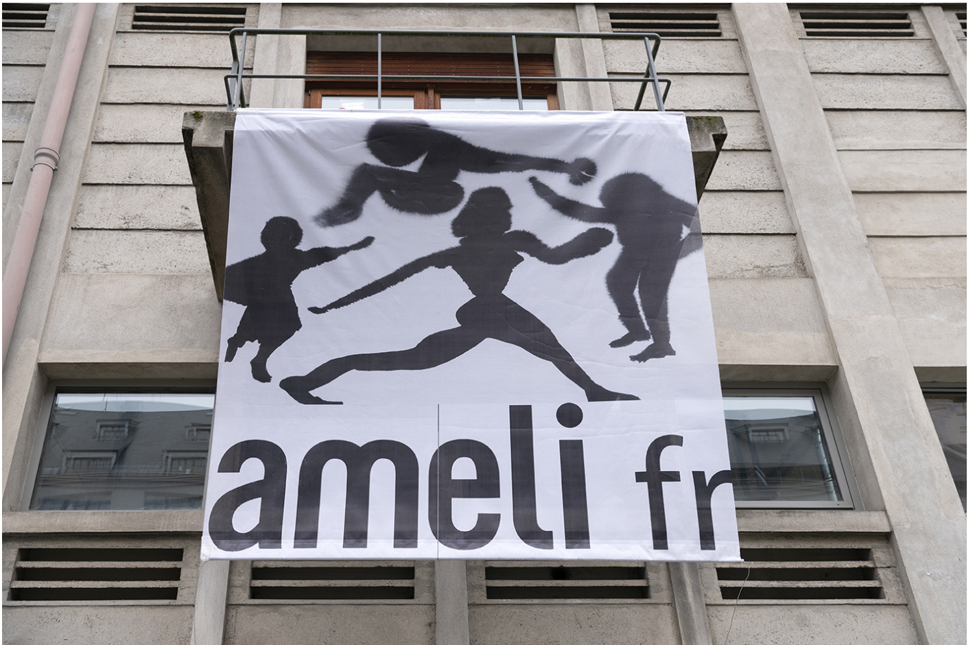
Ameli fr , 2024, Dessin imprimé sur bannière, Production Bétonsalon Vue de l'exposition de Florian Fouché, «SÉCURITÉ SOCIALE PRÉLUDE – Vies institutionnelles», Bétonsalon – centre d'art et de recherche, Paris, 2025.