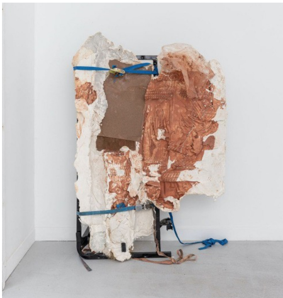
Florian Fouché, Papa et moi , 2022 Courtesy de l'artiste et de la Galerie Parliament, Paris. Photo : Romain Darnaud.