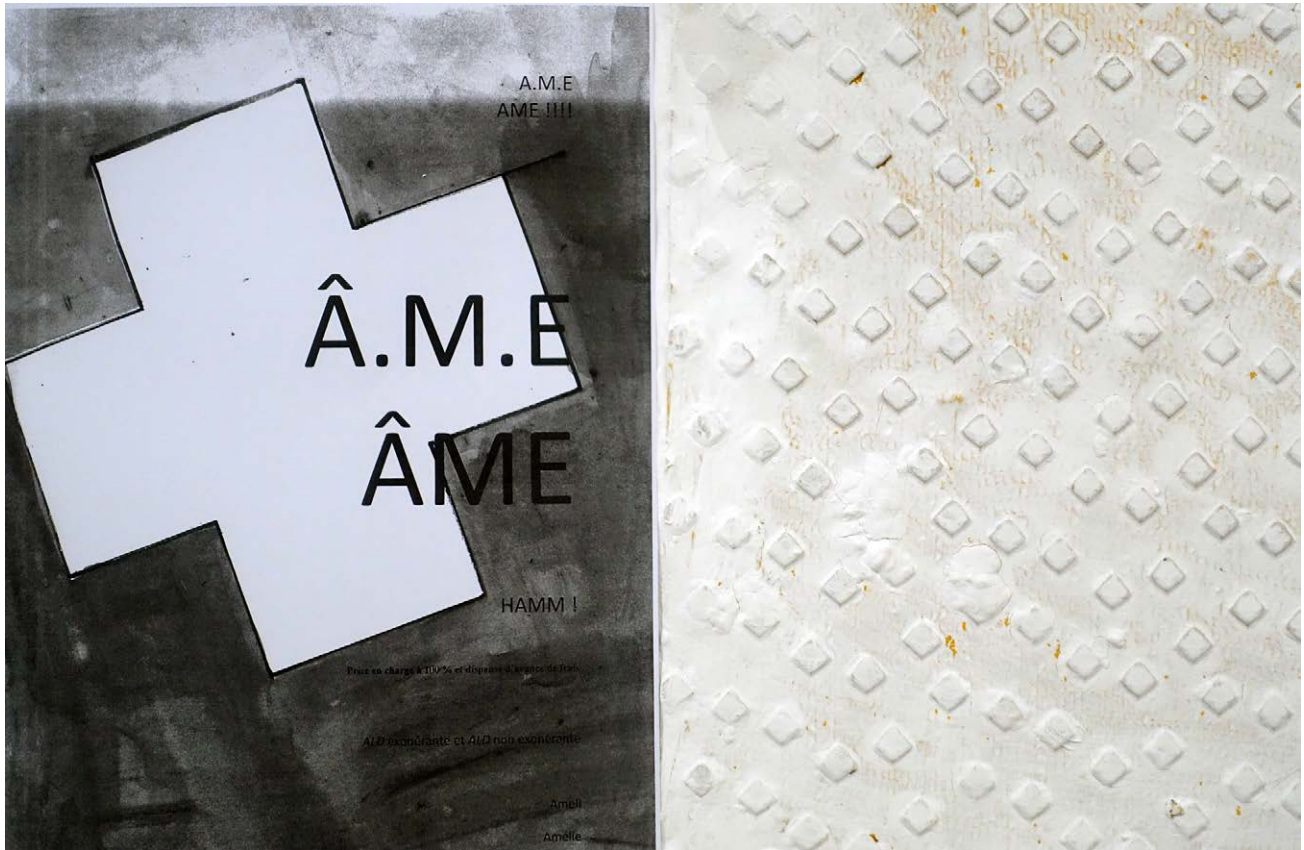
Florian Fouché, Passage de l'Â.M.E. (détail), 2024

Toile de coton, bandes de passage clouté adhésives, peinture, particules fines, tracts.