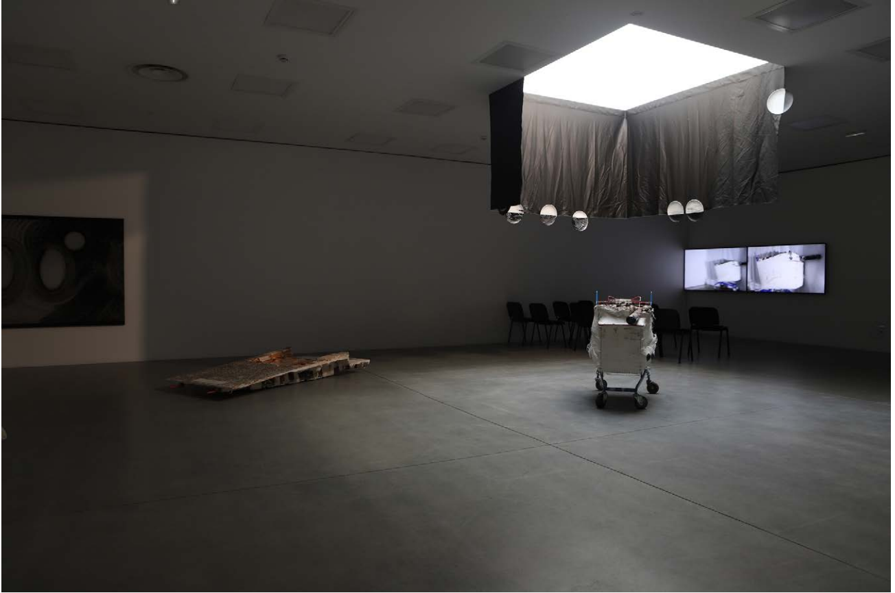
Vue de l'exposition «FIN DE PARTIE PRÉLUDE» de Florian Fouché, Centre d'art GwinZegal, Guingamp, 2024.