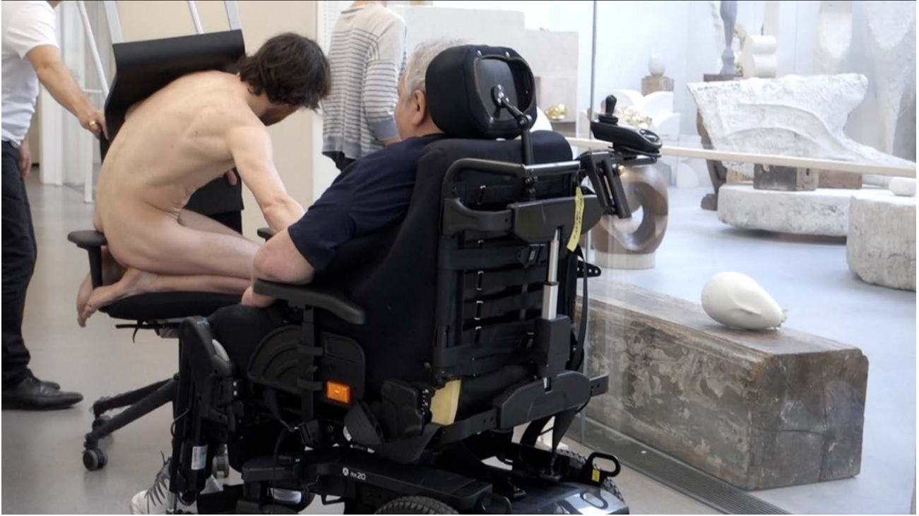
Florian Fouché, Vie institutionnelle , 2022 Vidéo.